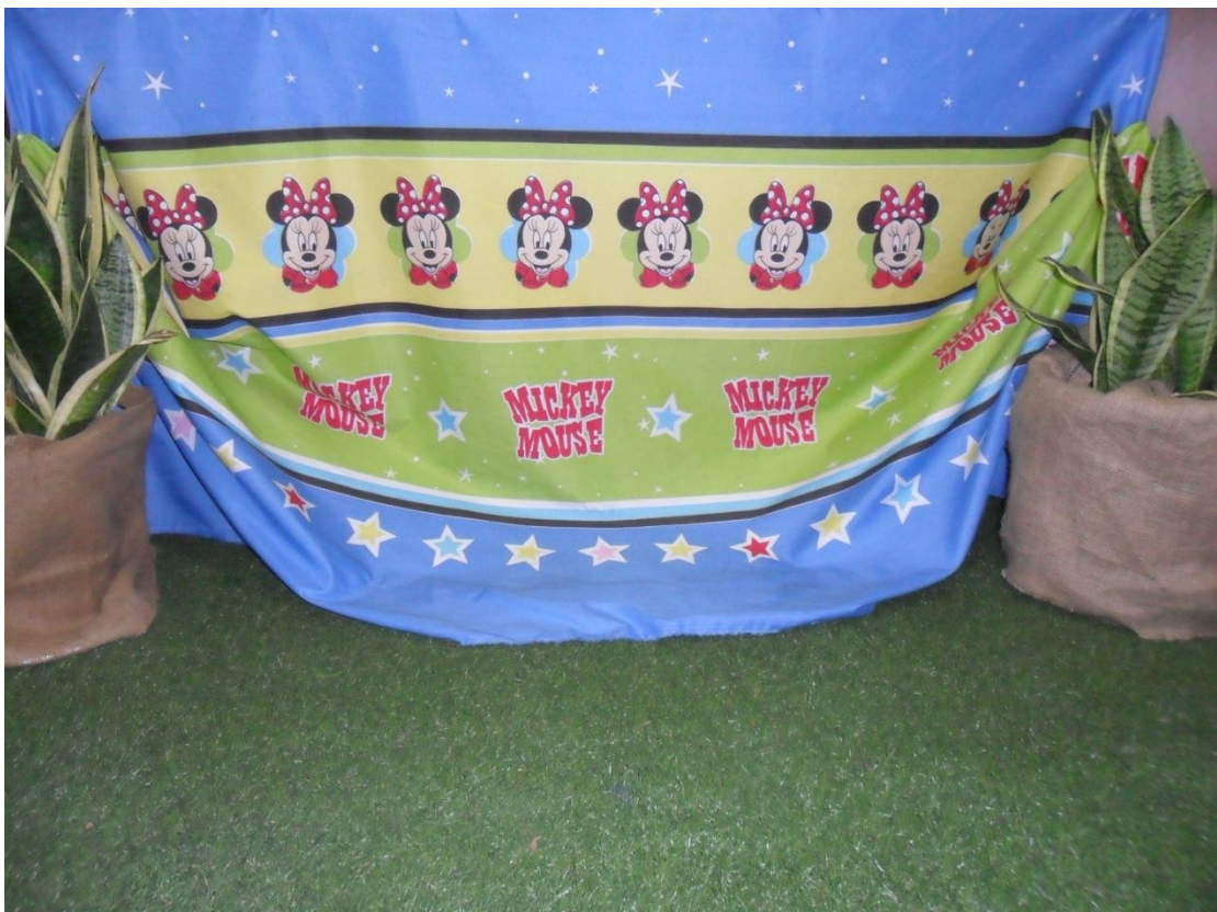
Κουρτίνα για την οποιαδήποτε διακόσμηση