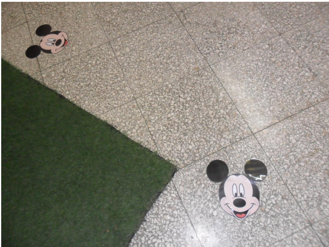
Φωτογραφίες του ΜΥΚΙ και στο πάτωμα