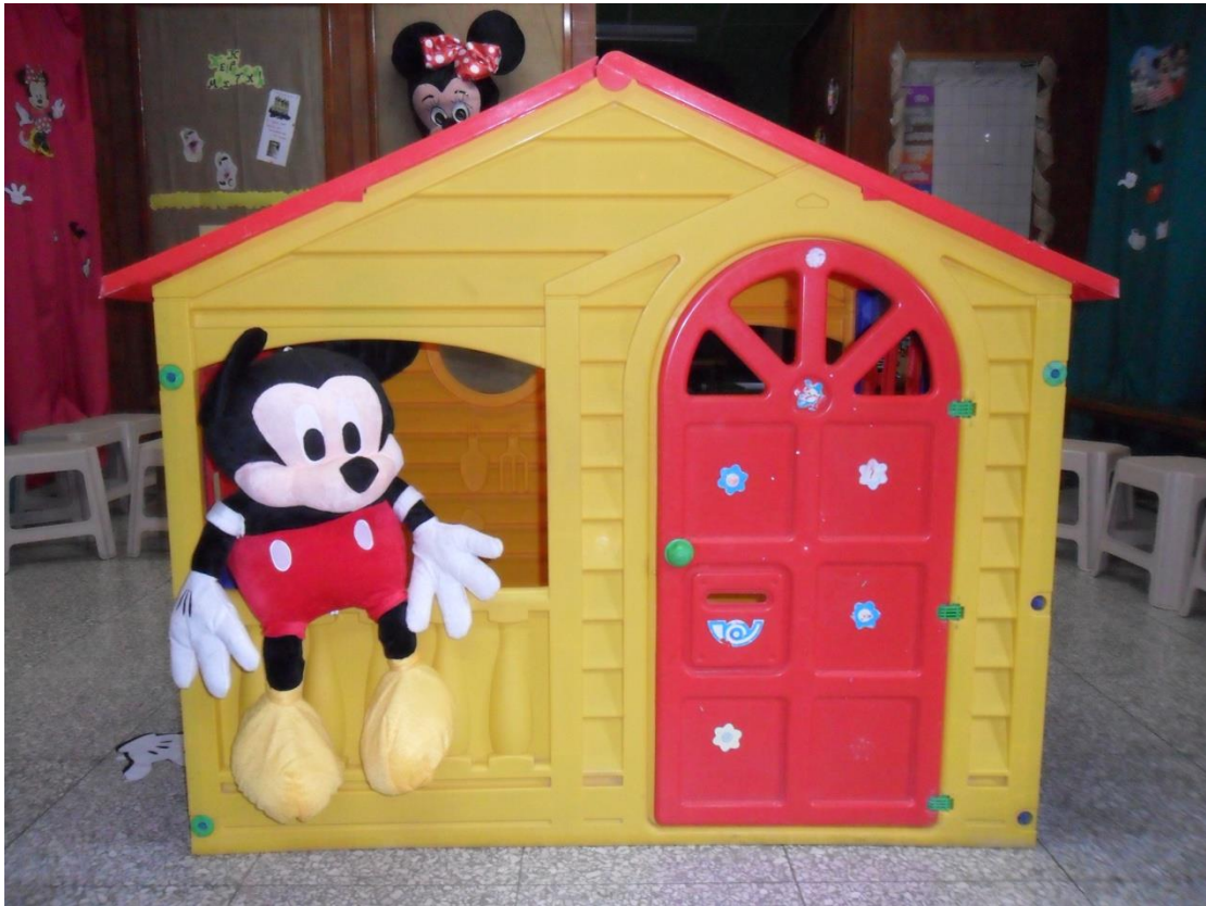
Το σπιτάκι του ΜΙΚΥ στην Αγέλη