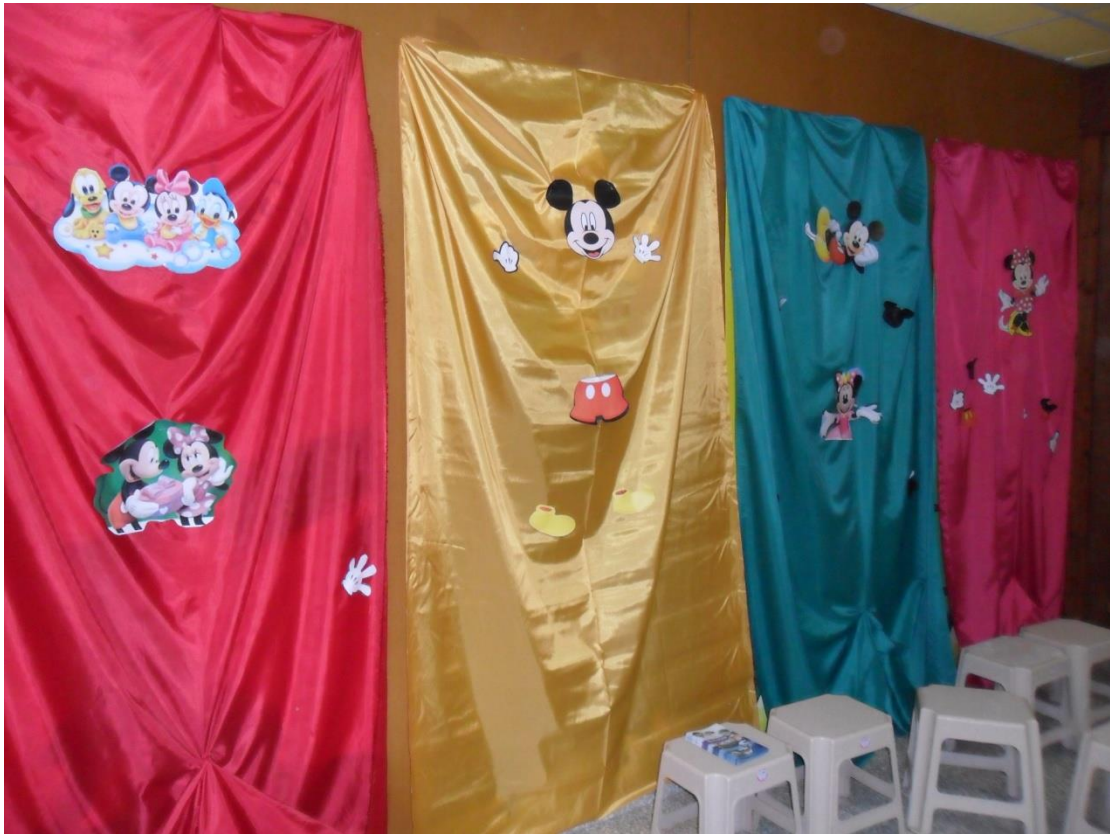
Διακόσμηση φωλίας. Απλά, οικονομικά και ωραία